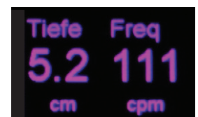
Figure 1. CPR Dashboard Anzeige für Tiefe und Frequenz. Im deutschsprachigen Raum finden sich hier cm-Angaben

Endlich ist Licht am Ende des Tunnels. Die ZOLL R Series mit dem "CPR Dashboard™" schaltet automatisch auf pädiatrische Anzeigen um. Es wird nun die tatsächliche Kompressionstiefe und -frequenz in Echtzeit angezeigt. (Figur 1)