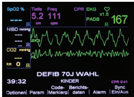
Figur 2. Monitor zeigt gefilterte und ungefilterte EKG-Kurve. (See-Thru CPR)

Zusätzlich führt ein Metronom zur korrekten Frequenz. Eine Anzeige weist die Dauer der CPR-Unterbrechungen aus und erinnert den Helfer daran wie schädlich CPR Pausen für die Behandlung sind. Die ZOLL eigene See-Thru CPR® Technologie ermöglicht es, während der CPR zu erkennen, ob sich ein organisierter Rhythmus entwickelt. Dies reduziert CPR Unterbrechungen erheblich. (Figur 2)